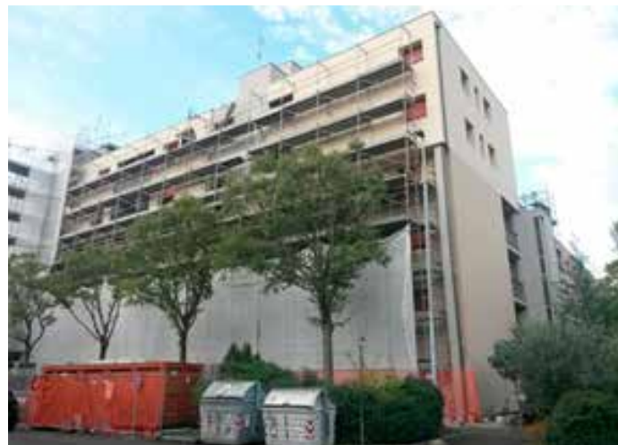
Modena Via Terranova Arezzo, edificio ERP con 93 alloggi. Anno di costruzione 1984, anno di riqualificazione energetica 2019