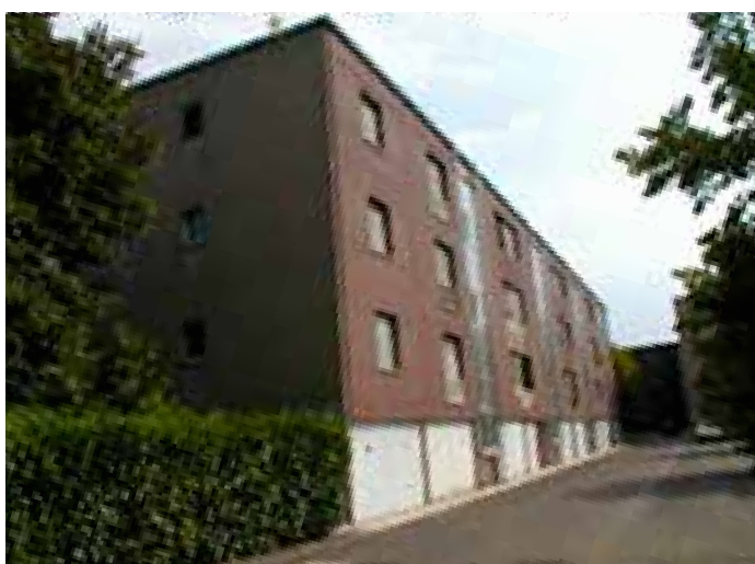
Modena Via delle Dalie 51, 53, 55, 57 e 61, 63, 65, 67, 69 (San Damaso), 2 edifici ERP con complessivi 57 alloggi. Anno di costruzione 1981, anno di riqualificazione energetica 2016