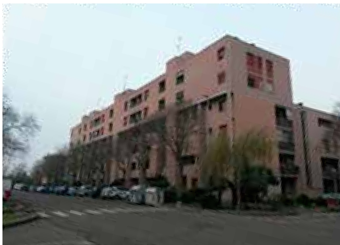
Modena Via Terranova Casalegno, edificio ERP con 93 alloggi. Anno di costruzione 1984, anno di riqualificazione energetica 2020