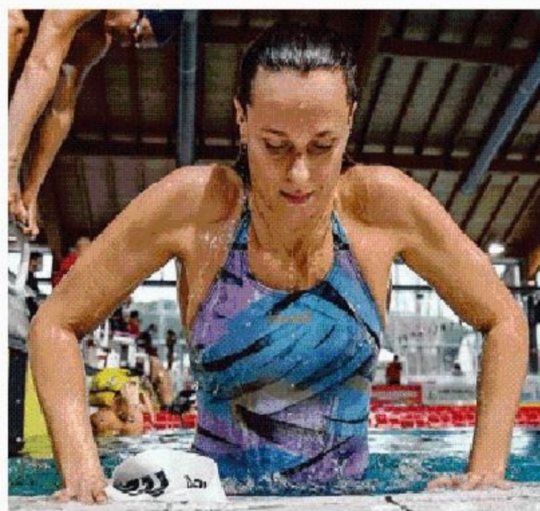
Federica Pellegrini, 32 anni