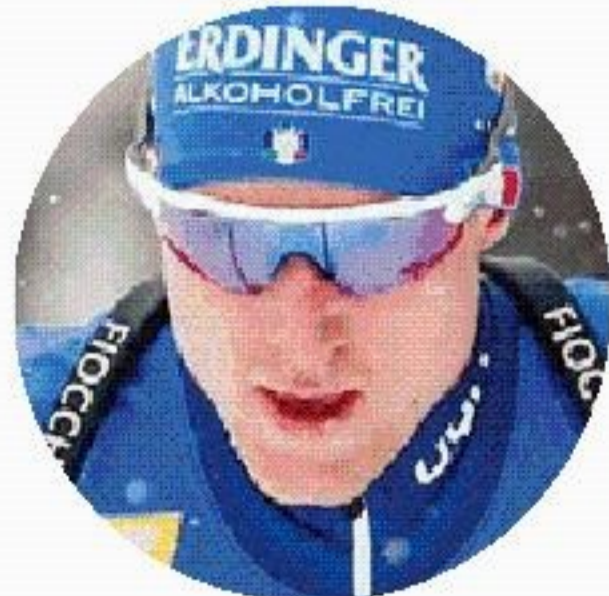
Lukas Hofer, 31 anni, alla seconda vittoria individuale in Coppa ANSA

Le nevi di Oestersund si tingono d'azzurro. Nella tappa conclusiva della Coppa del Mondo di biathlon, l'Italia fa la voce grossa nelle sprint e colpisce il bersaglio: Lukas Hofer trionfa tra gli uomini, mentre Dorothea Wierer si piazza seconda tra le donne. Per il trentenne carabiniere altoatesino si tratta del secondo acuto in carriera, a distanza di più di sette anni dal successo di Anterselva, quando condivise la gioia del successo col tedesco Simon Schemp.